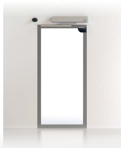
PUERTA BATIENTE DAB Y SPRINT