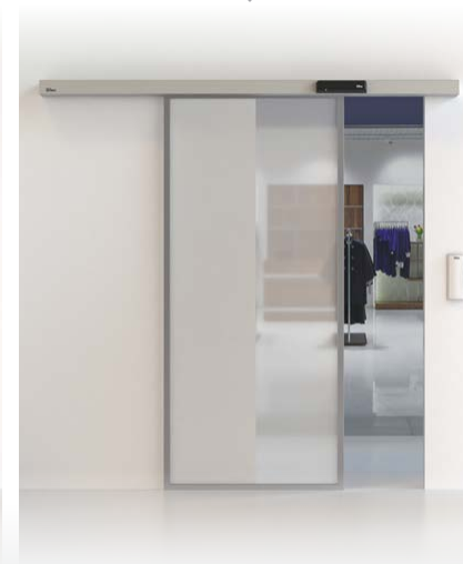
PUERTA CORREDERA CIVIK Y DAS