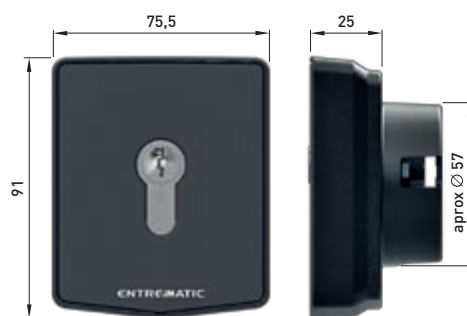
AXK5I - AXK5NI (versión sin cilindro)