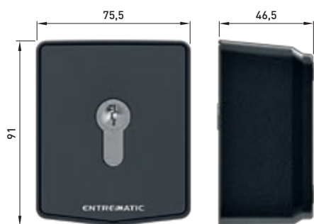
AXK5M - AXK5NM (versión sin cilindro)